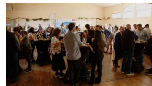
Plus de 80 participants, socio-pros, élus et techniciens

le 5 avril 2024 à la Salle Jean Nayrou et au Village Vacances des Lambrilles à La Bastide-de-Sérou